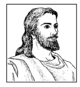
「你們得救的本乎 恩,也因著信,……乃 是神所賜的。也不是出 於行爲,免得有人自 誇。」—— 以弗所書 2:8、9