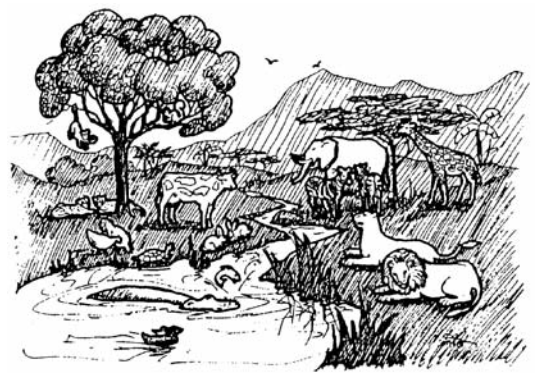
© 2012, World Missionary Press, Inc. Cover art, Edwin B. Wallace. Meryl Esenwein art above and on pages 10, 12, 14, 16, 27, 29, 39, 41, 42, 44, 46, 47, and 48.